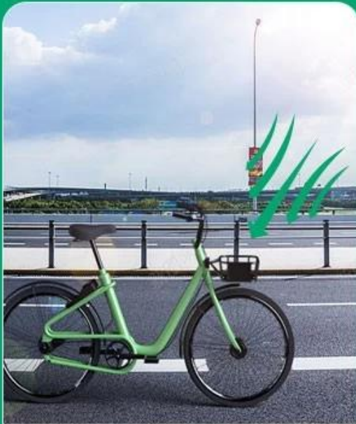
Solar panel charging