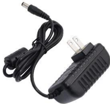
DC charging port

Usuários e operadores podem se comunicar com bicicletas compartilhadas ou elétricas por meio de travas inteligentes para bicicletas.