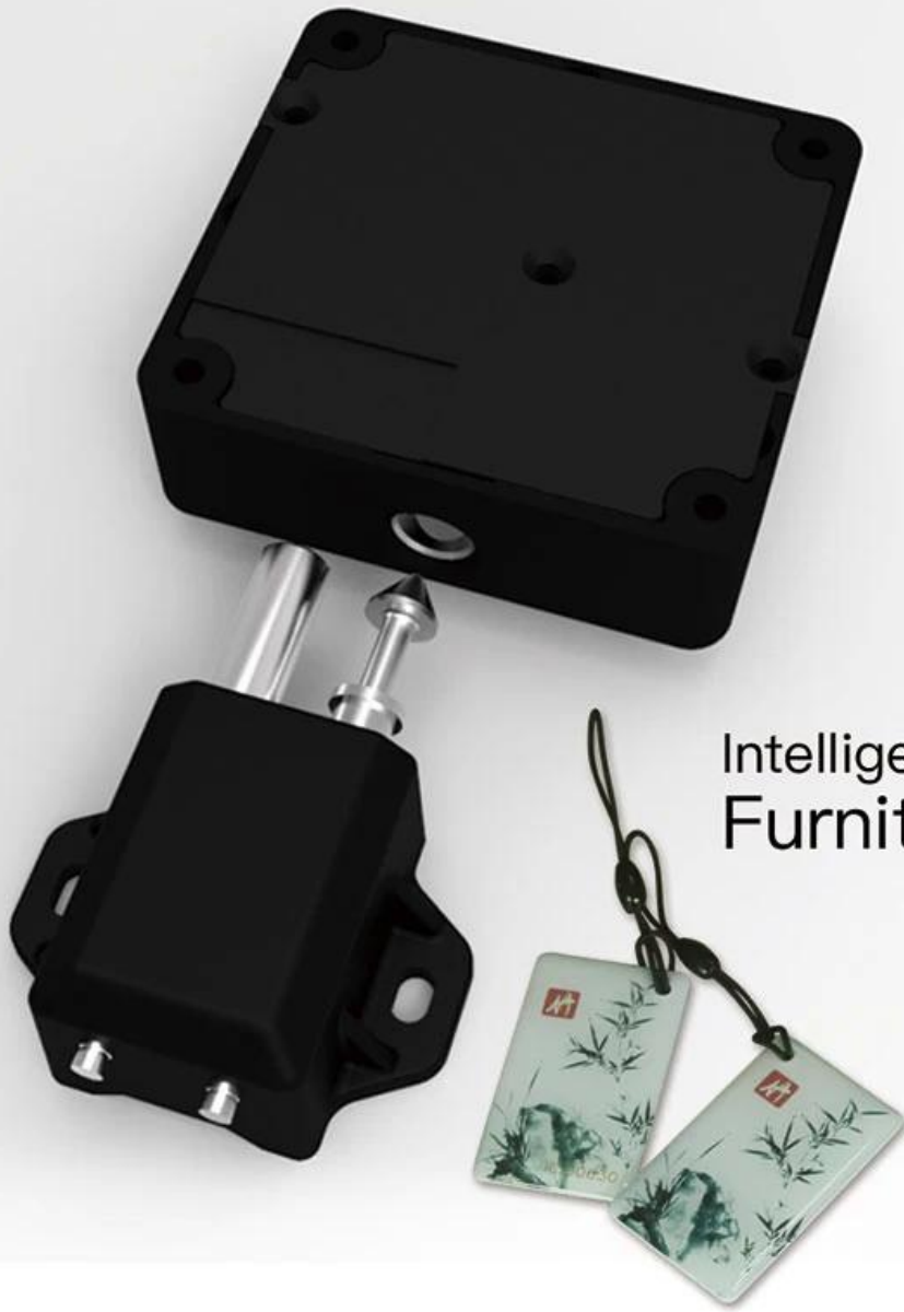
Intelligent Induction Furniture Lock