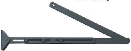
Push arm(alternative) outward opening