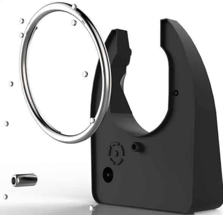
Al alloy shell, 10mm stainless steel circle, sealed plastic box inside