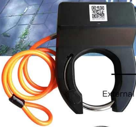
External Power: Solar Penal on the bike