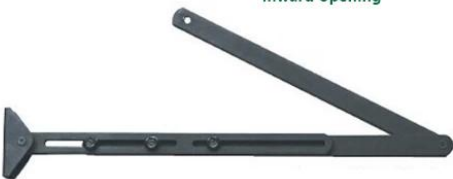
Push arm(alternative) outward opening