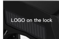
LOGO on the lock

If a customized logo required on the lock, customers should provide a logo and two-dimensional code size and source files.