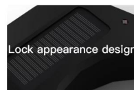
Lock appearance design

Less than 100,000 pieces for orders is required to pay the cost for the mold.