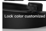
Lock color customized

Less than 100,000 pieces for orders is required to pay the cost for the mold if a new mold is required.