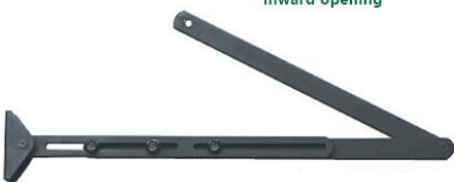
Push arm(alternative) outward opening