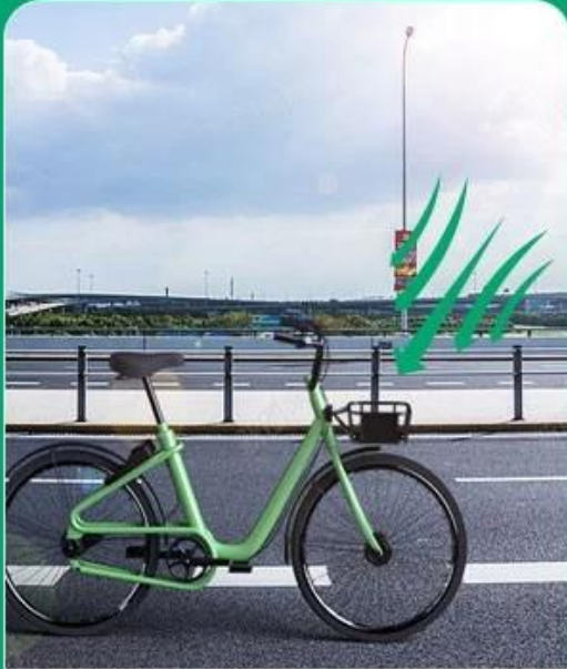
Solar panel charging