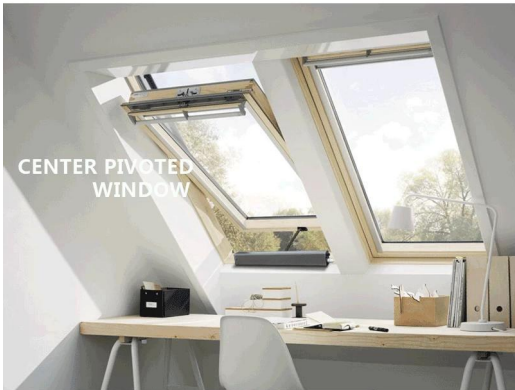
CENTER PIVOTED WINDOW