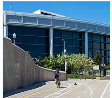
Commercial and Office Buildings