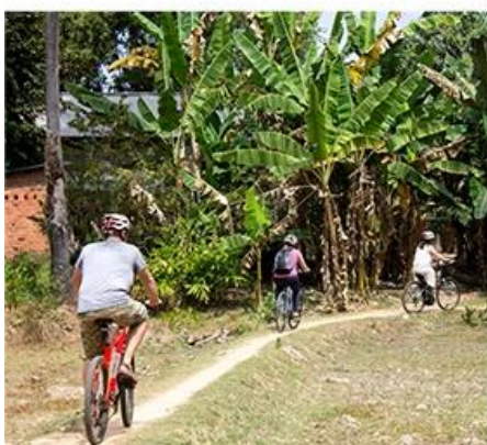
Countryside Sharing Bikes